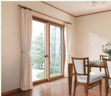
断熱内窓 (二重窓) インプラス

今ある窓の内側に新しい窓を取付けるだけ。1窓最短1時間のスピード施工で断熱性がアップして、結露も軽減します。